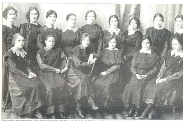
Выпускницы учительского класса Костанайской женской гимназии (1917-18). Багги на фоне: стилизованные портреты с элементами русской культуры.

Облыстағы орта білімнің дамуы неден басталды, кім педагог бола алды және сол уақыттың оқытушы кадрларының еңбек қағидалары қандай болды.