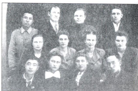
Дальневосточники, 1936 год.

Авторлар 1937 жылдан бүгінгі күнге дейінгі Таяу Шығыстан жер аударылған Қостанай облысының корейлері туралы тарихты әңгімелеген.