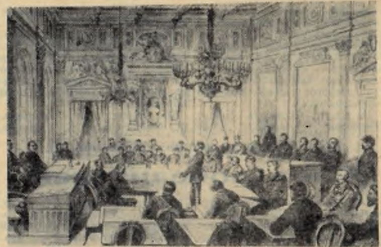
Пролетарская революция 18 марта 1871 года во Франции. Заседание Парижской Коммуны в ратуше.

Правильное и своевременное лечение ангины, а главное—предупреждение позволяет избежать развития столь распро-