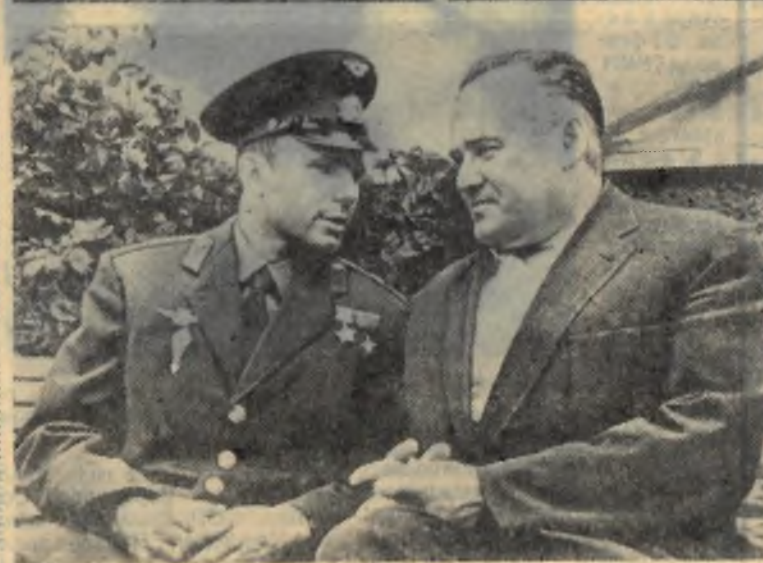
На снимках: летчики - космонавты СССР: П. Р. Попович, Ю. А. Гагарин, В. В. Николаева - Терешкова, А. Г. Николаев, В. Ф. Быковский, Г. С. Титов (1963 г.); Ю. А. Гагарин и академик С. П. Королев (1961 г.).