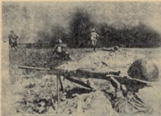
Подмосковье, 1941 год. Атака.