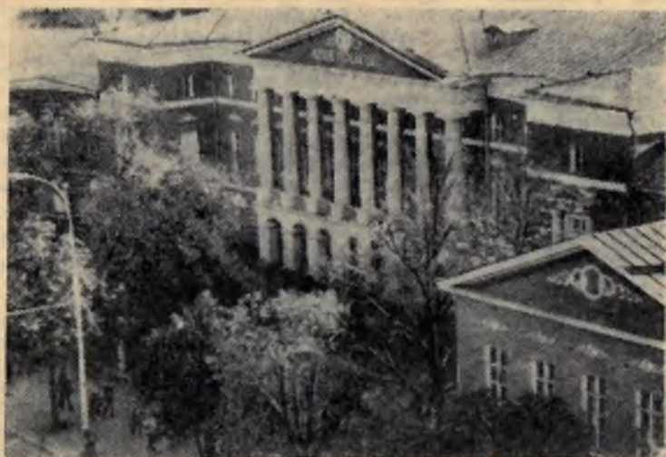
Москва. Более миллиона москвичей и гостей столицы посетят ежегодно Центральный орден Ленина и Октябрьской Рево-

люции музей Революции СССР. Экспозиция музея охватывает важнейший период истории нашей страны с конца XIX века до настоящего времени. Около миллиона экспонатов отражают историю Великой Октябрьской социалистической революции, гражданской войны, Великой Отечественной войны, героическую борьбу советского народа за построение социализма и коммунизма в СССР.