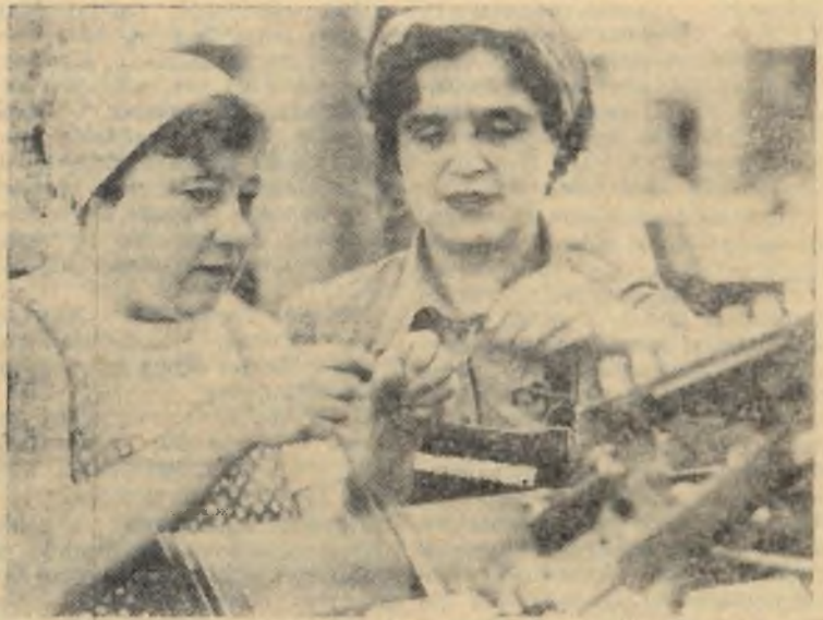
Москва. В коллективе шелкового комбината имени Розы Люксембург...

В ЖКО комбината организован и работает общественный отдел кадров. Его цель — закрепление кадров на местах, что так