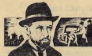
УБИТ ПРИ ИСПОЛНЕНИИ...

Новый фильм Германа Лаврова и Станислава Любимина (ки-