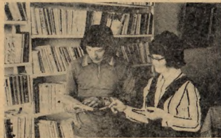
ОБСУЖДАЯ ПРОЕКТ КОНСТИТУЦИИ

Вышли вперед лисаковцы и в целом по соревнованию меж-