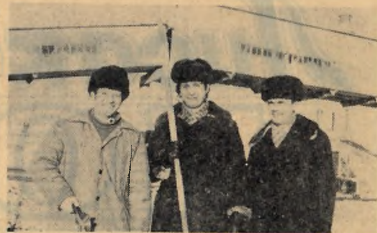
В конце 1977 года в Лисаковске введен в строй действующих молокозавод. Сейчас горожане получают молоко со своего завода.