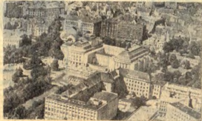
На снимке: центральная часть столицы Эстонской ССР города Таллина.

Советская Эстония — одна из 15 свободных и равноправных социалистических республик, составляющих великую интернациональную семью Союза ССР.