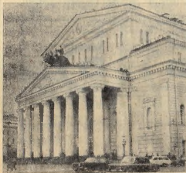
Большой театр Союза ССР.

◆ 26 СЕНТЯБРЯ В. И. Ленин написал письмо членам Политбюро ЦК РКП(б),