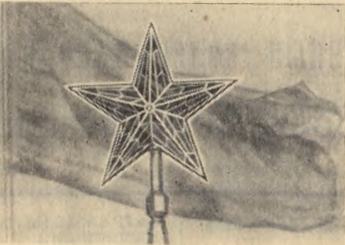
Над Московским Кремлем реет Государственный флаг СССР и горяят алые звезды на Кремлевских башнях — как путеводные звезды народного счастья.

Поэтому долг родителей, кадровых рабочих — наставников воспитывать свою смену на примерах боевой и трудовой славы нашего народа трудолюбивой, энергичной, чтобы лозунгом ее