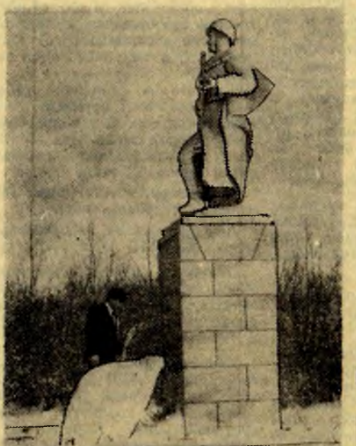
СПАСИБО ВАМ, ДАВШИМ НАМ БУДУ-

В книжном магазине вы можете оформить заявки на лите-