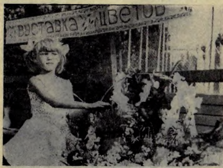
ВЫСТАВКА ЦВЕТОВ.