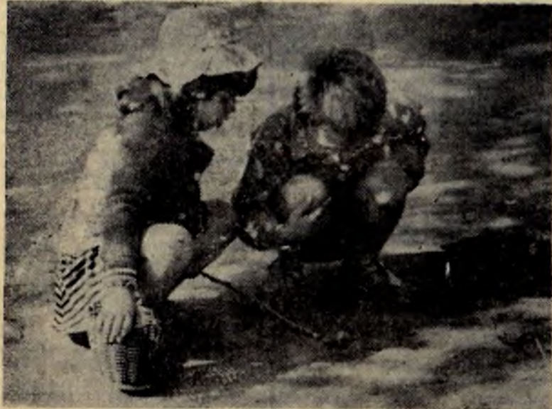
ЭТО ОЧЕНЬ ИНТЕРЕСНО!