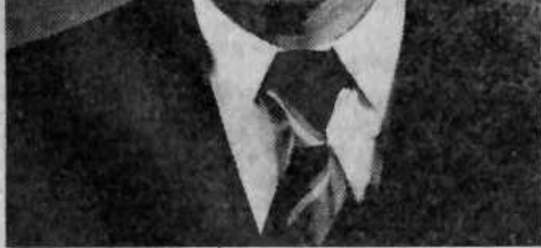
Человек славен делами. Фраза, ставшая уже привыч-

к работе, какой бы тяжелой работа ни была.