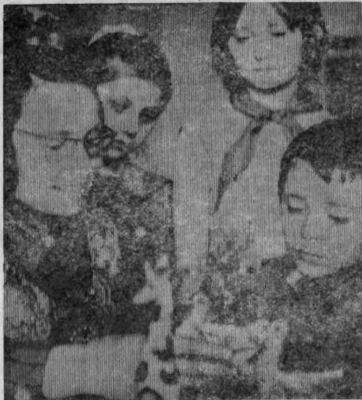
В СВОБОДНЫЙ ЧАС...