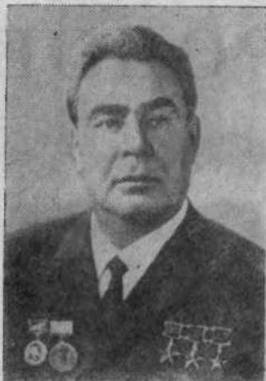
Генеральный секретарь ЦК КПСС, Председатель Президиума Верховного Совета СССР товарищ Леонид Ильич БРЕЖНЕВ.