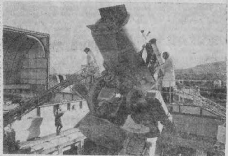
На снимках: Столица Таджикской ССР — Душанбе.

За годы десятой пятилетки в республике будут освоены и обводнены 60 тысяч гектаров целинных земель. Площадь орошаемых земель составляет 528 тысяч гектаров.