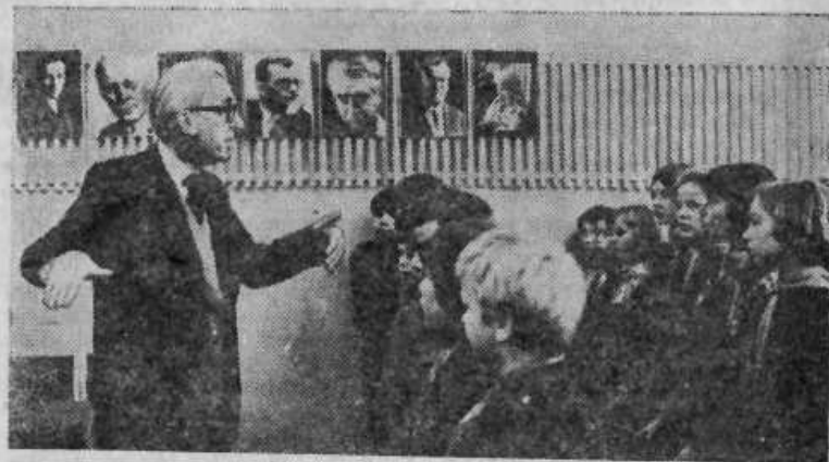
МОСКВА. Пятый год ведет музыкальные занятия с ребятами