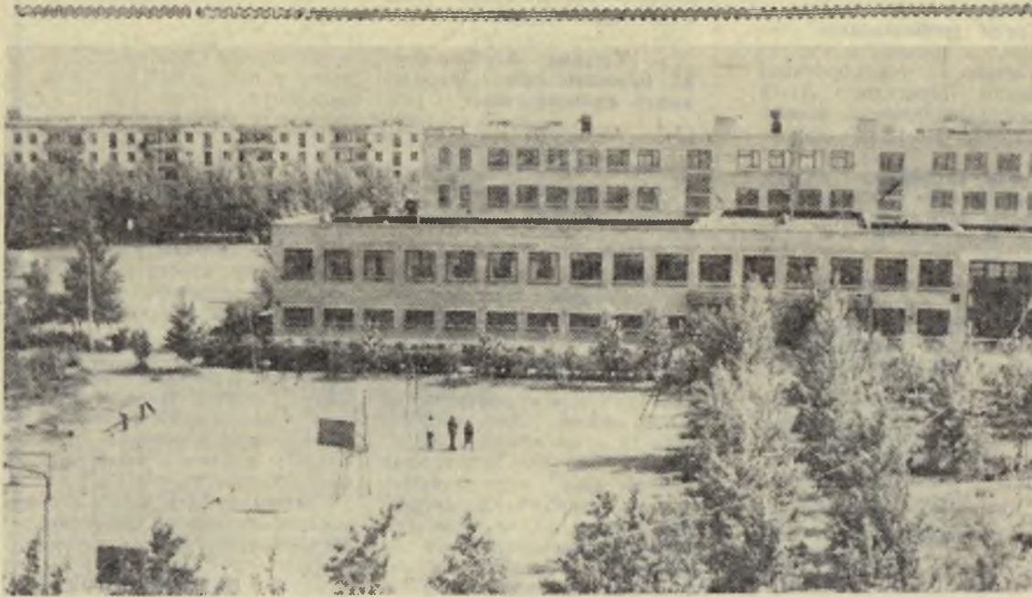
ЗЕЛЕНЕЮТ УЛИЦЫ ЛИСАКОВСКА