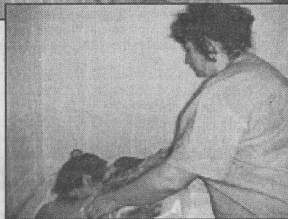
«Принял грязь - будешь князь», - утверждают знатоки.