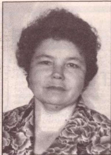
На снимках из семейного архива: такие мы были и есть!