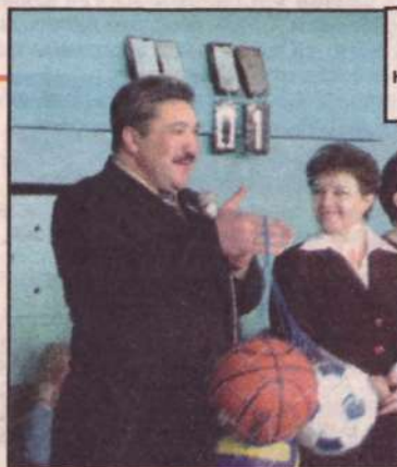
На снимках: момент вручения подарков и момент игры.

ГКП «Общезитие» в 2005 году отработало без убытков. Но и прибыли не было.