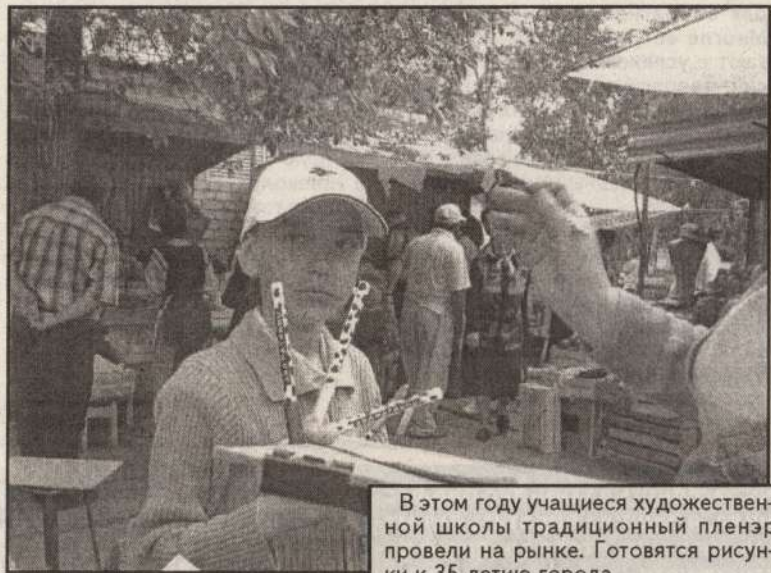
В этом году учащиеся художественной школы традиционный пленэр провели на рынке. Готовятся рисунки к 35-летию города.