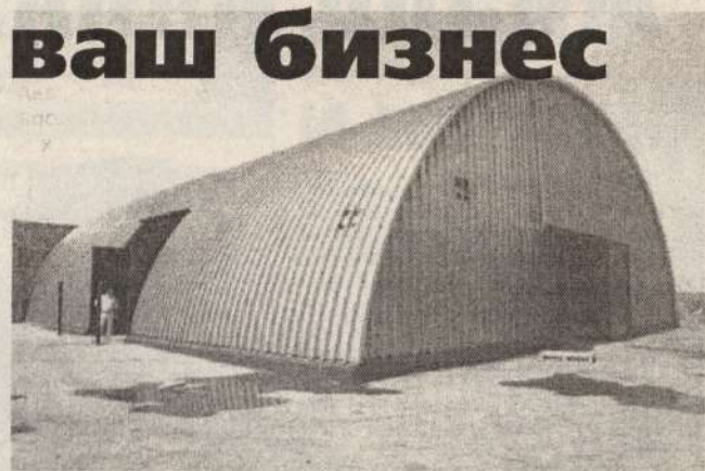
Объект - под ключ.

Расскажем вам историю, которую в Костаная передают, так сказать, по тряпочному телефону. Один почтенный предприниматель, делая заказ в ТОО «Формика» на сооружение бескаркасного арочного модуля, сильно усомнился, что фирма управится за 10 дней - фантастически короткий срок. Сам предложил заключить договор на месяц - на всякий случай. Но уже на десятый день уважаемый клиент принял сооружение к эксплуатации. Рабочие завершили последние работы, а он уже размещал свой бизнес - под новую крышу. Эффективный результат привел в «Формику» и других заказчиков. Опять же не особо доверчивых. В процессе общения с менеджерами они выясняют, какие преимущества сулит им новое приобретение. И как это за десять дней можно построить то, что будет служить десятилетия. Для наглядности им демонстрируют весь процесс монтажа в виртуальном исполнении. На мониторе компьютера очень хорошо видно, какие процессы выполняются в первый день, во второй - и так до десятого. С помощью забортовочной машины арочные элементы соединяются между собой в секции по 5 штук прочным герметичным швом. Этот процесс продолжается до достижения необходимой длины здания. Длина может быть какой угодно, ширина - от 6 до 22 метров. Автокраном арочные секции устанавливаются вертикально и соединяются между собой с помощью все той же забортовочной машины... Менеджеры ТОО «Формика» показывают и макеты