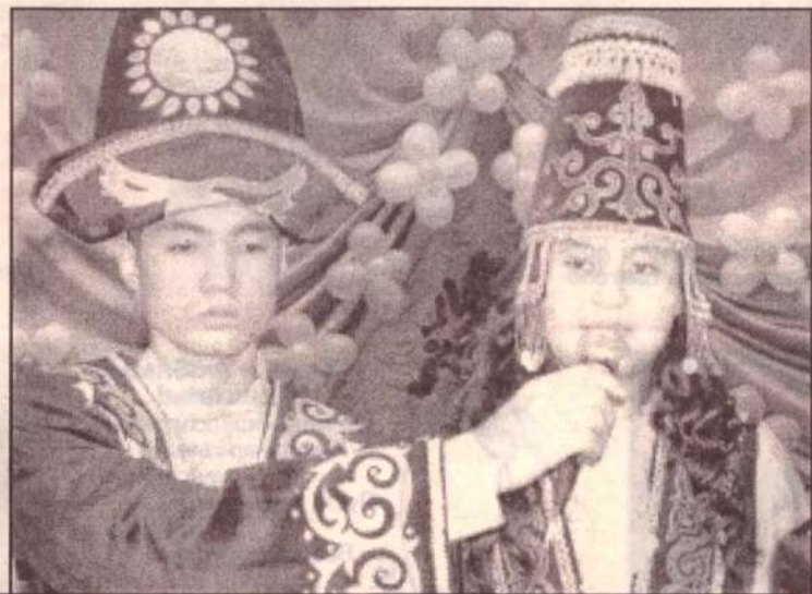
Фото и текст Е. СПОДАРЬ.

«Джигиттин Султаны» 26 февраля прошел в необычном формате: султана выбирали из юных джигитов. На этот раз ими были шесть учеников 8«б» класса СШ №3. Самый-самый должен был отличаться и артистизмом, и спортивностью. Трогательным и необычным был конкурс «Подарок родителям». Участники конкурса выходили на сцену с подарком для своих мам и пап, читали им стихи и благодарили за любовь и заботу. Некоторые джигиты даже посвятили своим мамам песни.