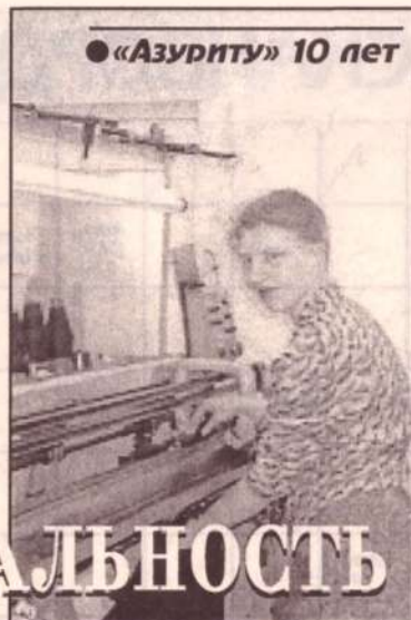
● «Азуриту» 10 лет