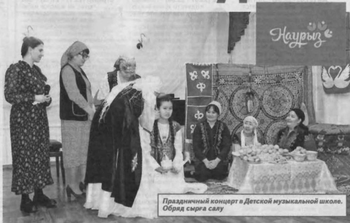
Праздничный концерт в Детской музыкальной школе. Обряд сырға салу

В Детской музыкальной школе 15 марта состоялся праздничный концерт, посвященный Наурыз мейрамы. Для родителей воспитанников и гос-