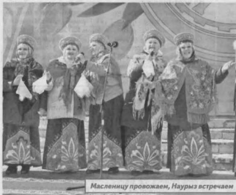
Масленицу провожаем, Наурыз встречаем