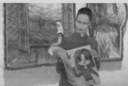
На открытии выставки «Таинство ручной работы» в Лисаковском музее истории и культуры Верхнего Притоболья

Второй день празднования Наурыза - «Қайырымдылық», День милосер-