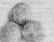
ЛАУРИТА с кокосовой стружкой