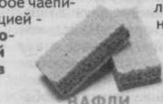
ВАФЛИ В АССОРТИМЕНТЕ