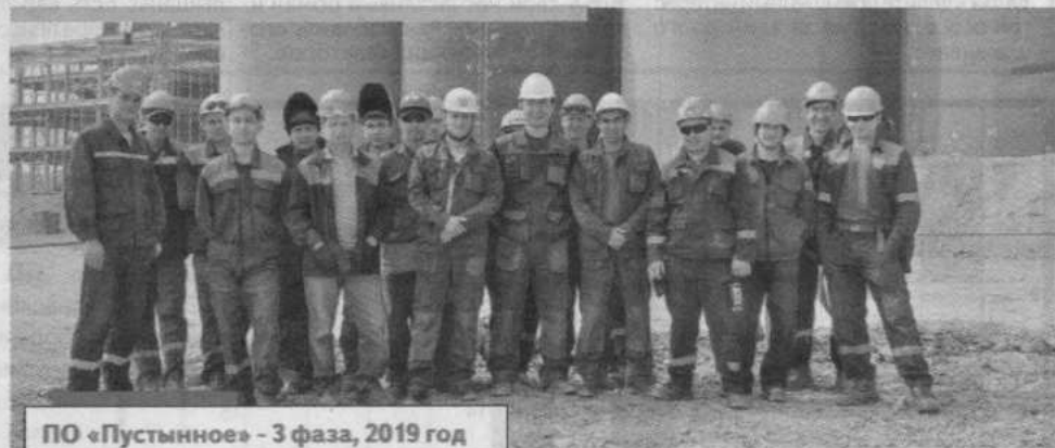
ПО «Пустынное» - 3 фаза, 2019 год

му предприятию нужны дополнительные квалифицированные кадры рабочих. Своим трудом сегодня мы создаем успешное завтра для предприятия.