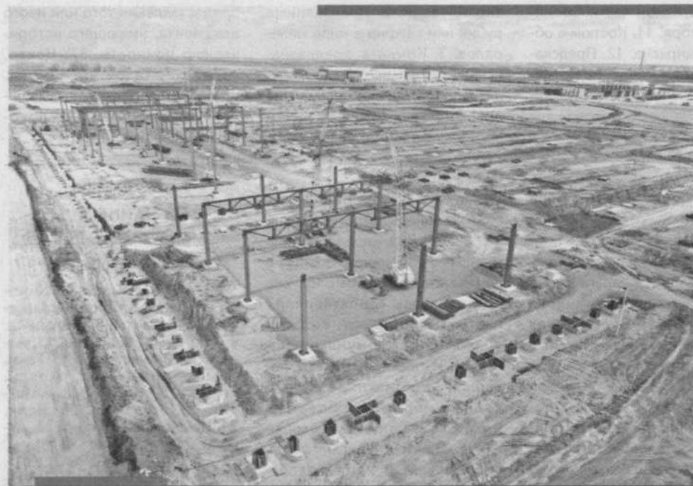
Строительство завода полного цикла по производству автомобилей KIA в Костанайе