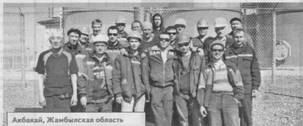
Акбакай, Жамбылская область