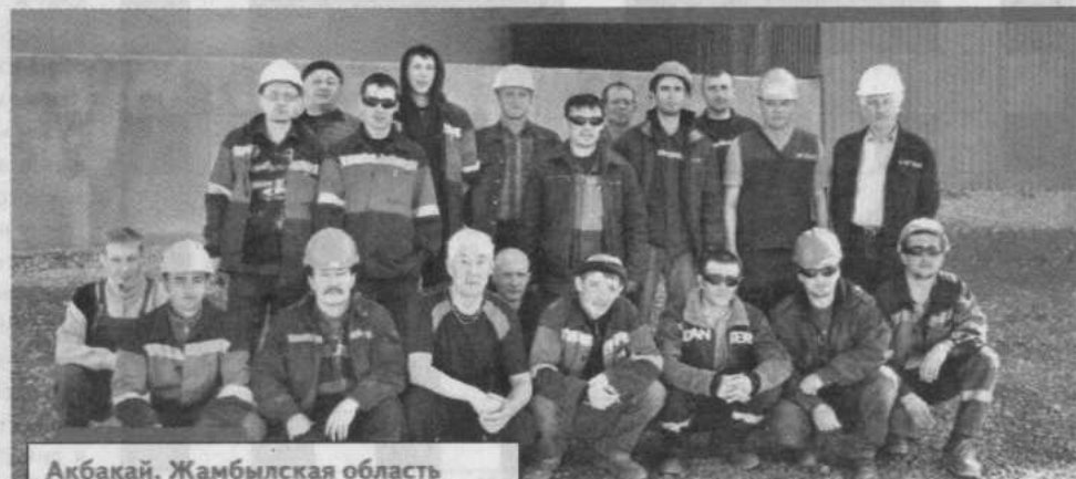
Акбакай, Жамбылская область