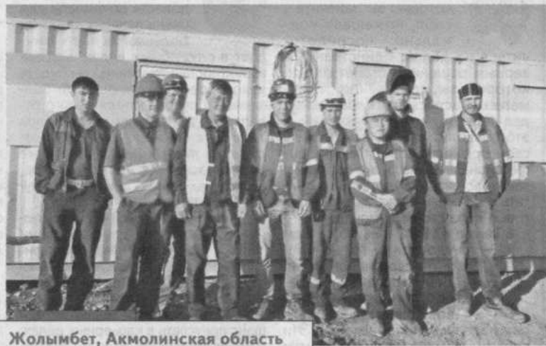
Жолымбет, Акмолинская область

ТОО «Лисаковская монтажная фирма - Имсталькон» празднует юбилей - 55 лет своей трудовой деятельности! В городе у нас таких фирм-старожил всего две. Эта компания стала символом упорства и профессионализма в промышленном строительстве Казахстана. Пройдя путь от небольшого управления до успешного самостоятельного предприятия, фирма может гордиться богатой историей и современными достижениями.