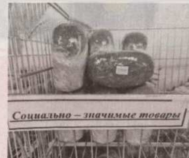
Социальная полка в супермаркете «Казына»

Производится выборка продукции из АО «СПК Тобол» по закупочной цене: макаронные изделия - 250 тенге за килограмм (цена реализации - 260 тенге), гречневая крупа - 135 тенге за килограмм (цена реализации - 155), масло сливочное - 3450 тенге за килограмм (цена реализации - 3500), масло подсолнечное - 500 тенге за литр (цена реализации - 520), мясо кур - 900 тенге за килограмм (цена реализации - 1000), рис - 412 тенге за килограмм