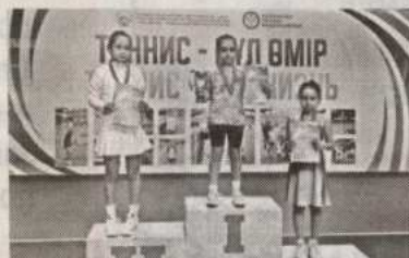
● Спортивный капейдоскоп

Только соблюдая все эти правила, можно устранить опасность возникновения пожара в чердачных и подвальных помещениях, в сараях,