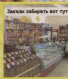
Заказы забирать вот тут

Вы заказываете, мы привозим то, что заказали.