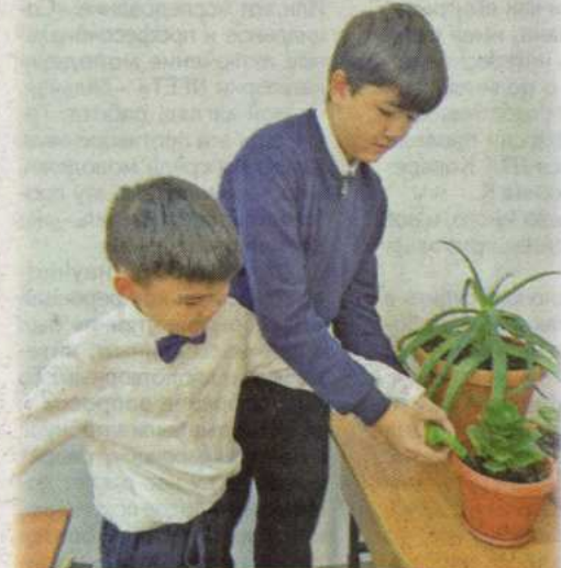
Гүлді осылай суарады

Біз, клуб мүшелері, қоршаған ортаға қамқорлық жасауды, адамдарға және табиғатқа көмектесуді басты мақсатымыз деп