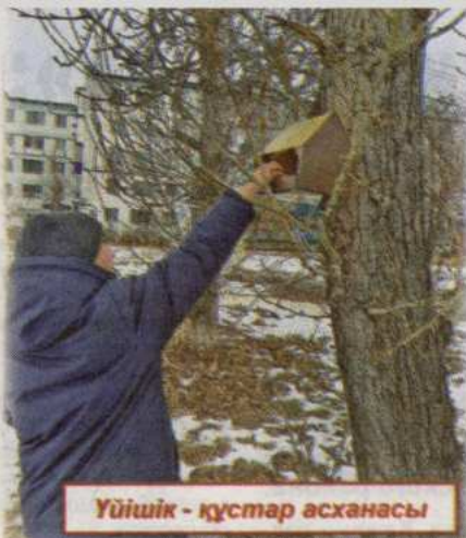
Үйшік - құстар асханасы

Бұл кішкентай құстардың қысты аман өткізуіне көмектесетініне сенімдіміз. Құстардың табиғат экожүйесіндегі маңызды рөлін түсіну бізге ерекше әсер қалдырды. «Жас ұрпақ» клубы маған тек жақсылық жасауды ғана емес, ұжымдасып жұмыс істеуді, қайырымдылық