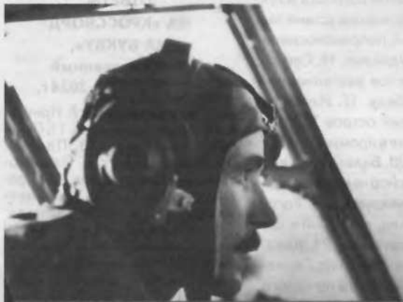
Борттехник всматривается вперед, чтобы определить, обстреливать дувал или нет