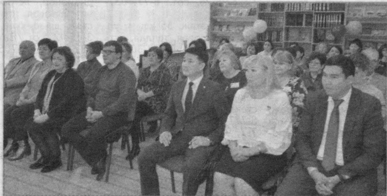
Юбиларов пришли поздравить гости

Праздник закончился, гости разошлись по домам. Но библиотеки города продолжают свою работу, их двери по-прежнему открыты для читателей.