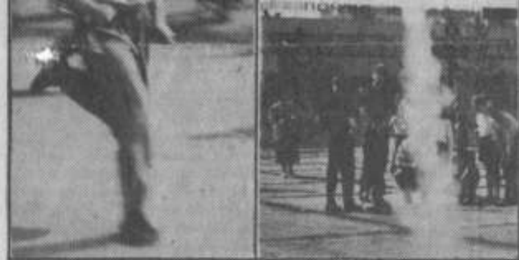
ПРАЗДНИК С СЕДИНОЮ НА ВИСКАХ.