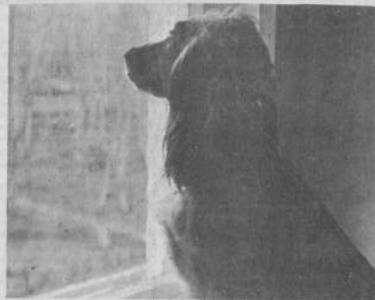
За окном что-то интересное...