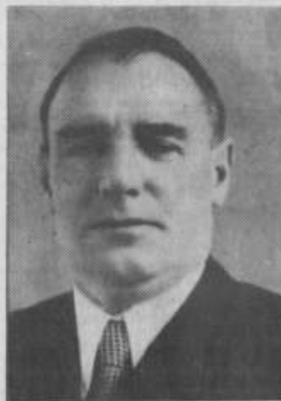
началом строительства очень деятельный, неутомимый человек В. У. Сарjosов.

оформили его и жену слесаря. А на деле - их проекты давали жизнь нашей Козыревке. Был спроектирован поверхностный по-