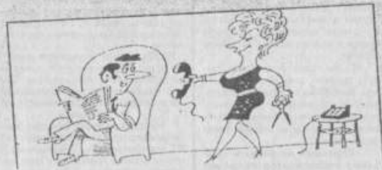
- Милый, тебя какой-то женский голос!

стутиться более всего портит внешний вид женщины, старит ее. Она не скрадывает недостатки фигуры, в частности груди, а лишь подчеркивает их.