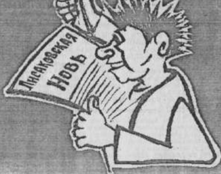
← Текст А. Байанжетовой.