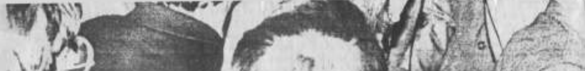
Н. Назарбаев и Лисаковские. 14 августа 1996 г.

Другие предприятия заказывают здесь спецодежду: от халатов до фуфаек. И все заказы, если