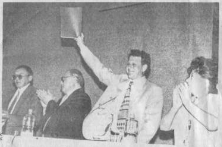
Накануне 25-летия города. Вот он - Президентский Указ в Лисаковской СЗД!