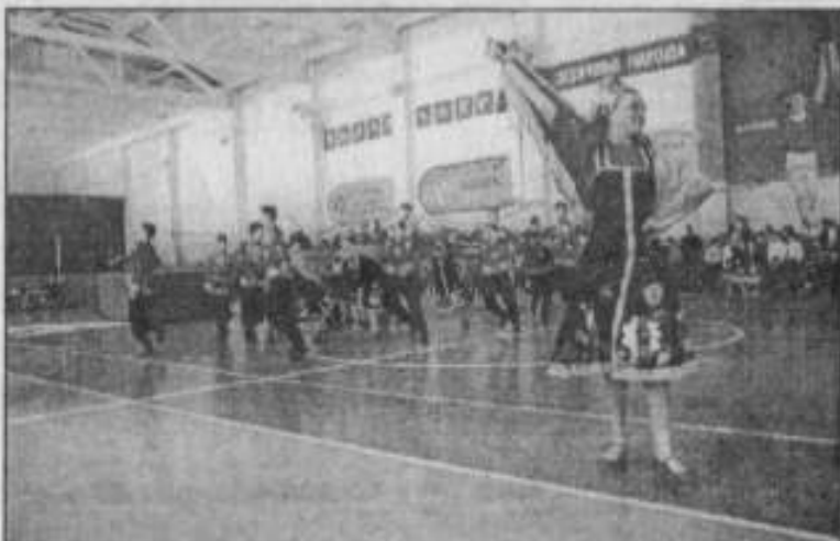
Зажигающий душу танец.

Завершилась демонстрация мод шуточным конкурсом. Из трехметровых отрезков ткани девушки должны были, не разрезая их, соорудить наряды для мужчин.