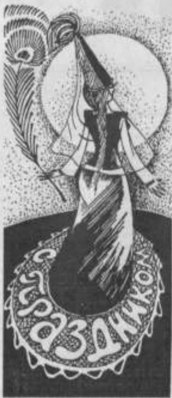
Мужчины с кличем "Будак

В первый день нового года, на заре, мужчины аула, взяв в руки кетмени, лопаты, а женщины - молоко, курт, вареное мясо и т. д., собирались в установленном ме-