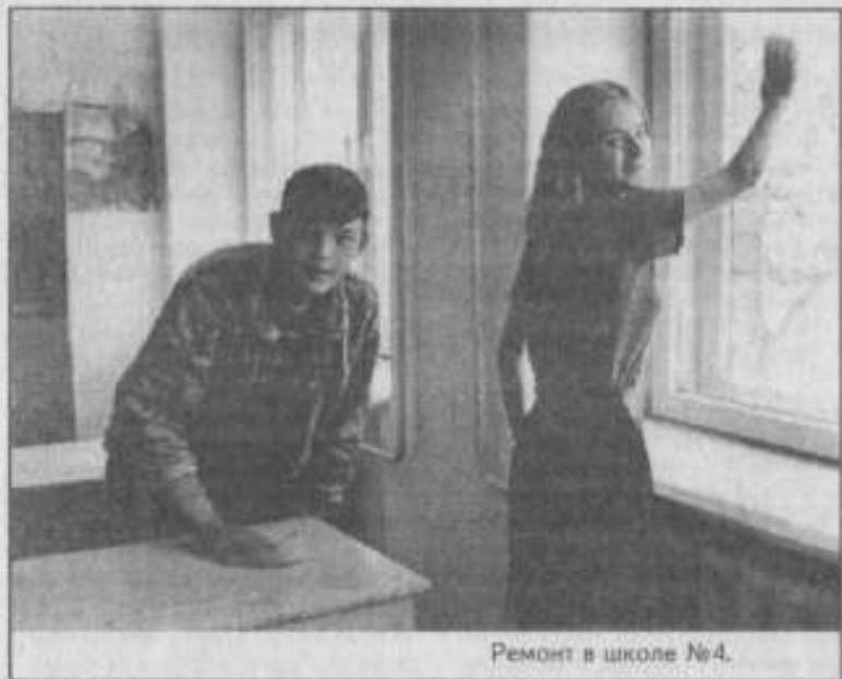
Ремонт в школе №4.

ПРОДОЛЖАЕТ свою работу в летний период Дом школьников. Немало интересных мероприятий провели его педагоги на школьных оздоровительных площадках.