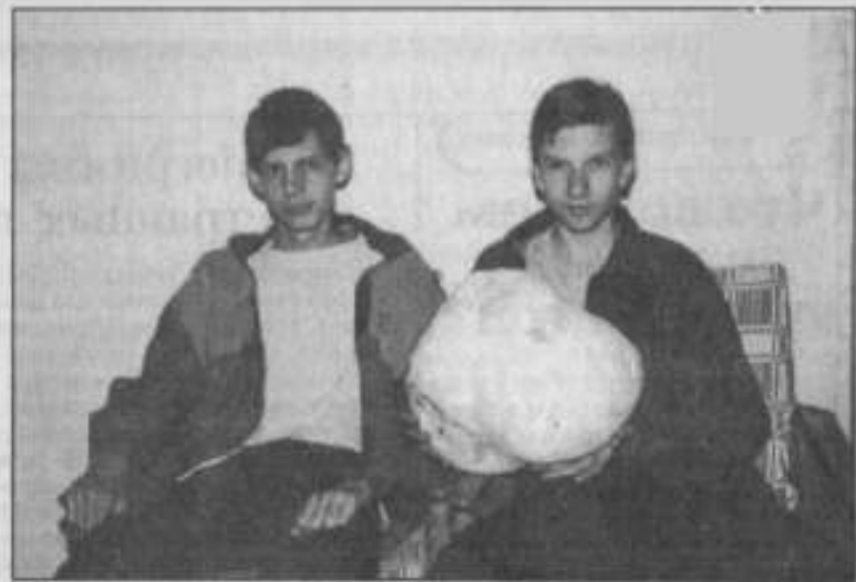
Вырос гриб - на удивленье...