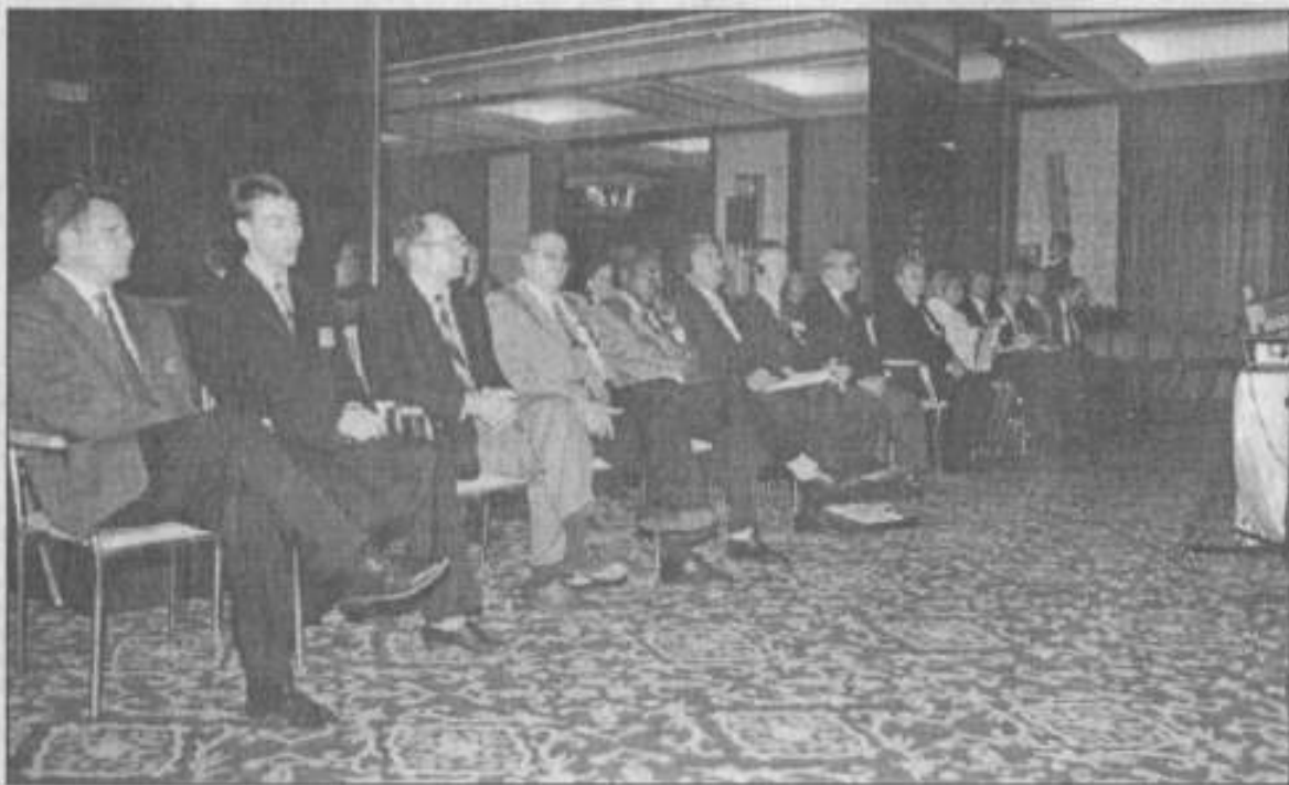
На снимке: рабочий момент конференции.