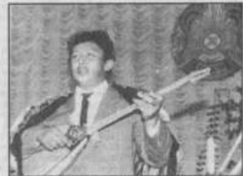
Идет "Жигиттин султаны"