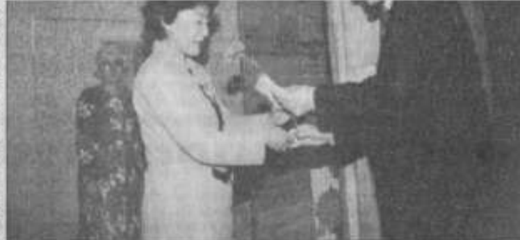
Вручение лучшим людям города премий

самым музыкальным жюри признало Ертугана. Затем джигиты вытянули карточки с вопросами истории Казахстана, культуре и национальных традициях. Надо было видеть, с каким воодушевлением и интересом смотрели на участников в программе и аксакалы, и молодые, сидящие в зале, как они сопереживали всему, что происходило на сцене. Пожалуй, самым приятным был конкурс объяснения в любви. Хоть джигиты и подбирали для этого самые красивые слова в казахском языке, но тут все было понятно и без слов. О содержании беседы молодых можно было судить по блеску в