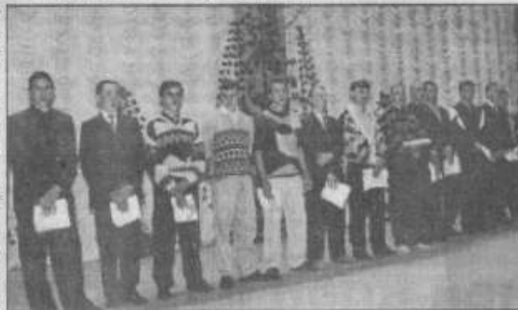
Проводы в армию