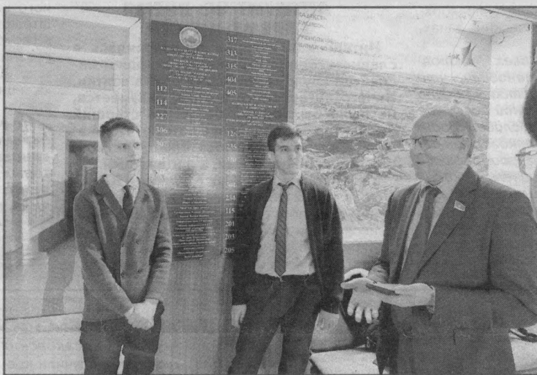
Встреча со студентами и преподавателями

В Рудненском индустриальном институте он занимался и общественной деятельностью — к пятому курсу был уже председателем профкома. Диплом защитил на двух