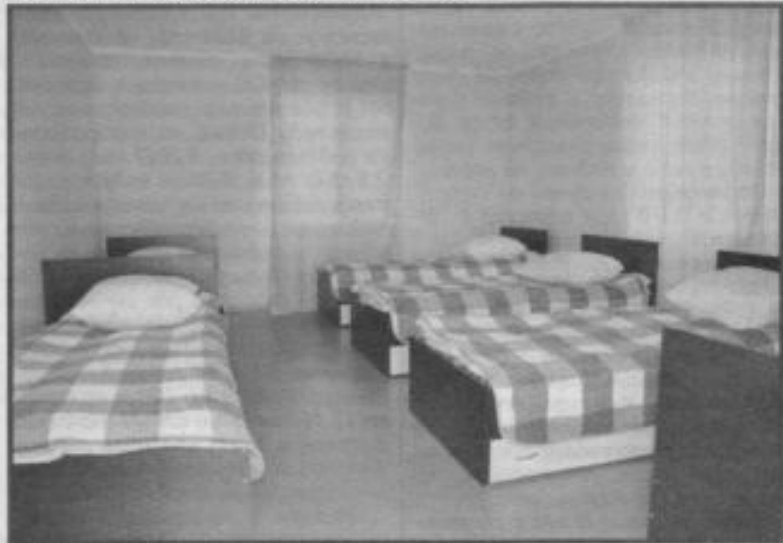
В каждом домике будут жить 6 человек

начнут строительство асфальтированной дороги до лагеря «Алый парус», чтобы поездка в детство и домой была удобной.