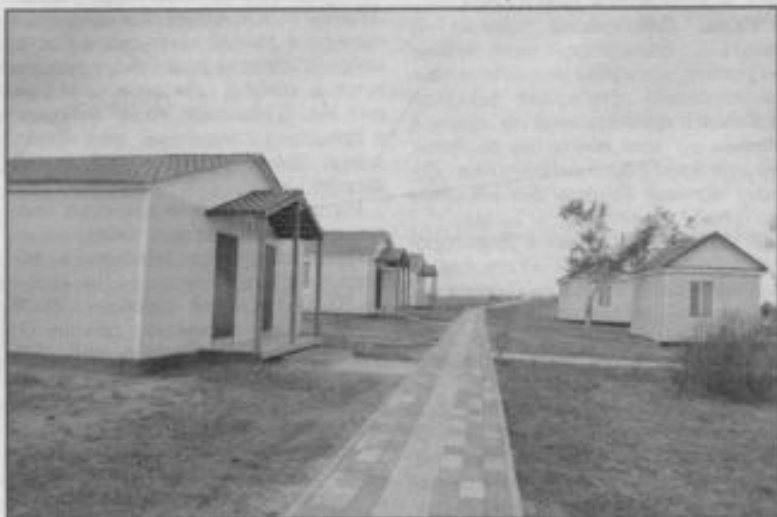
И новые, и реконструированные старые

организовывать мероприятия и досуг вожатые единой детско-юношеской организации «Жас Улан».