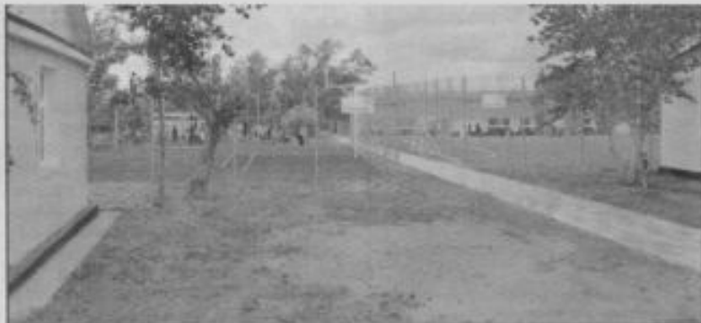
На территории появились спортивные площадки

мы крупных предприятий могут закупать путевки для детей своих работников.