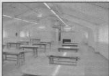
Внутри измененной столовой

Остается еще заняться в будущем вопросами озеленения территории (часть деревьев давно высохла, часть высаженных в прошлом году не прижилась), а в 2024 году