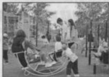
Есть игровая зона

Стоимость путевки в этом году на 10 дней составляет 25 тысяч тенге — родители эти деньги платят исключительно за питание, все остальные затраты берет на себя городской бюджет. В 2024 году, как сказала Елена БУРДЫКА, стоимость путевки увеличат. Профко-