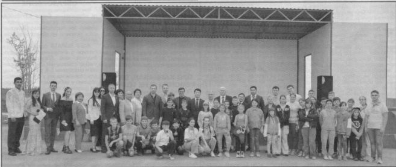
Общее фото на память возле сцены

Свой полувековой юбилей «Алый парус» встречает в новом облики. И пусть здесь каждый Грэй дождется свою Ассоль, все отдохнут, наберутся сил, энергии, зарядятся эмоциями, которых хватит до следующего летнего приезда в наш «Алый парус»!