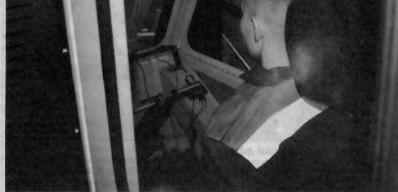
Симулятор кабины экскаватора

Кстати, о заработной плате. На заседании круглого стола, в работе