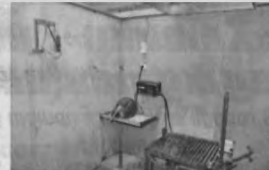
Рабочее место сварщика