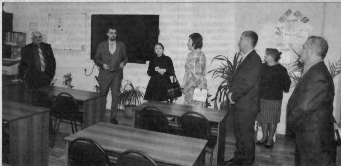
Организаторы и участники Дня работодателя