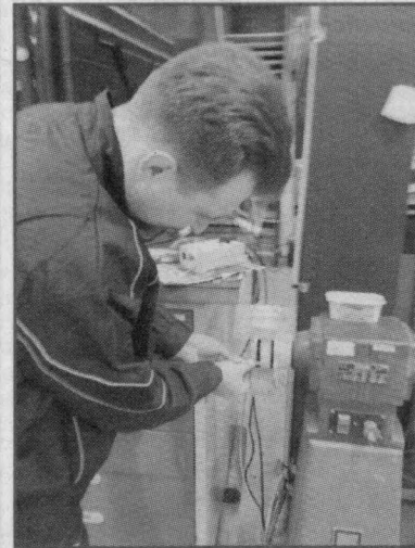
Практика на оборудовании во французском колледже

— Как нам всегда говорят, мы должны готовить высококвали-