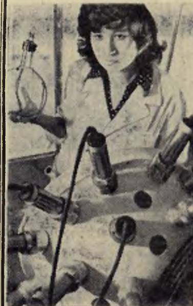
Москва. Новая лаборатория